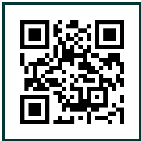
ФАС В КОНТАКТЕ